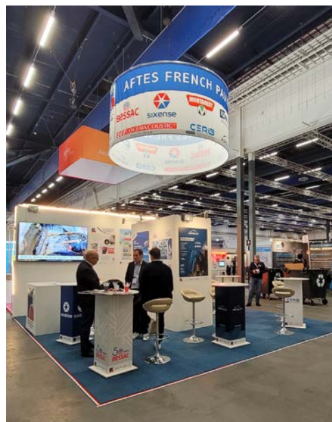
WTC 2025 – Stockholm Exemple stand