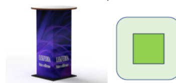
Table haute personnalisée