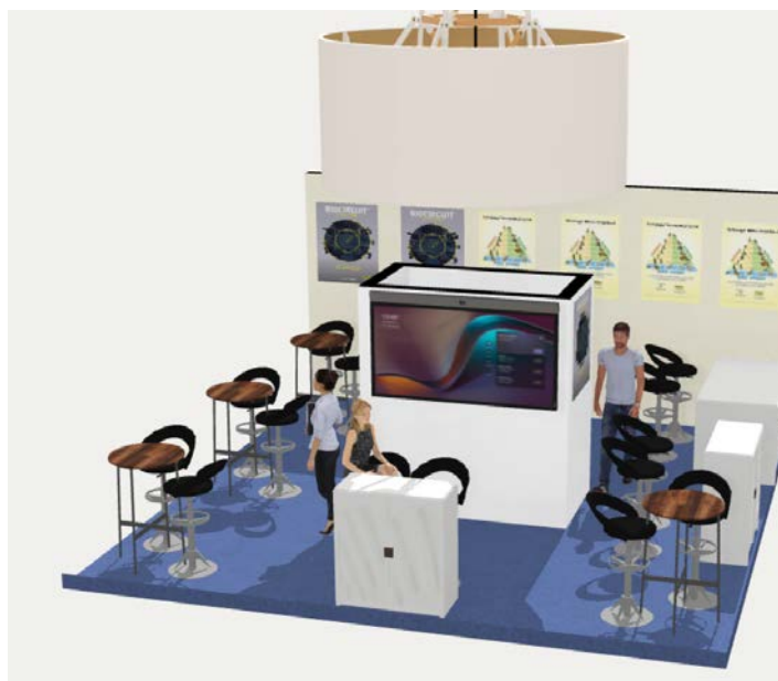
WTC 2026 – Plan 3D – Stand B0505 Image non contractuelle