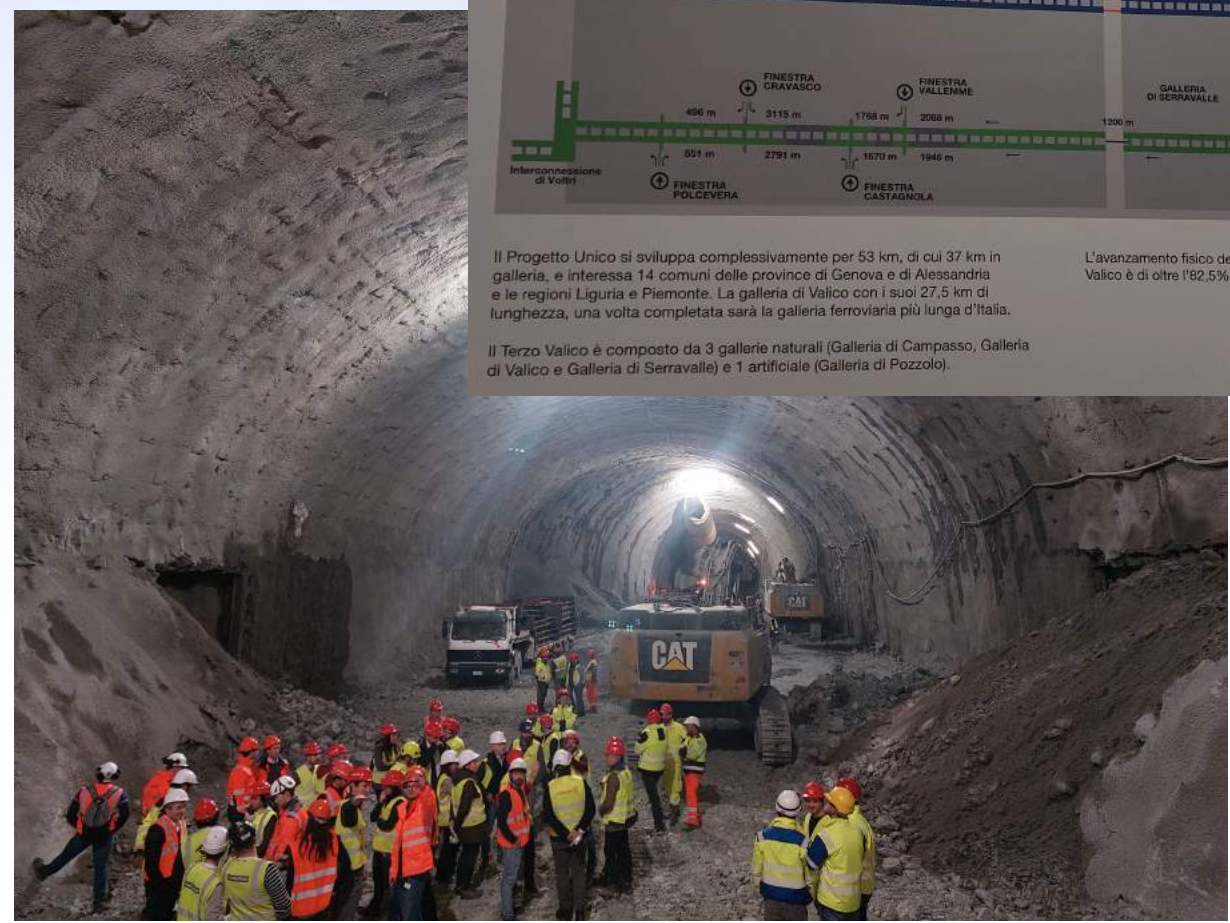
Visite des galeries