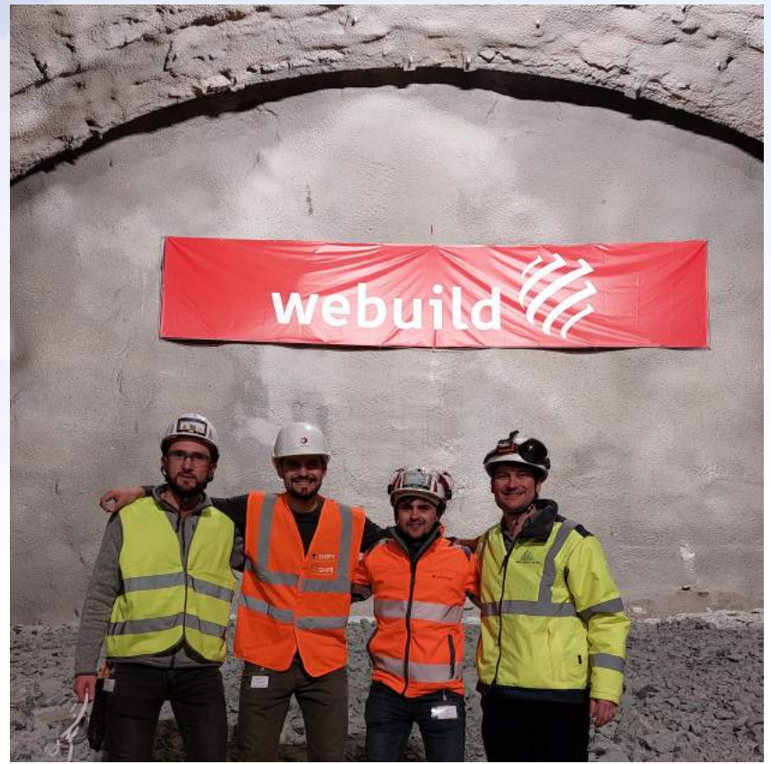
L'équipe des français