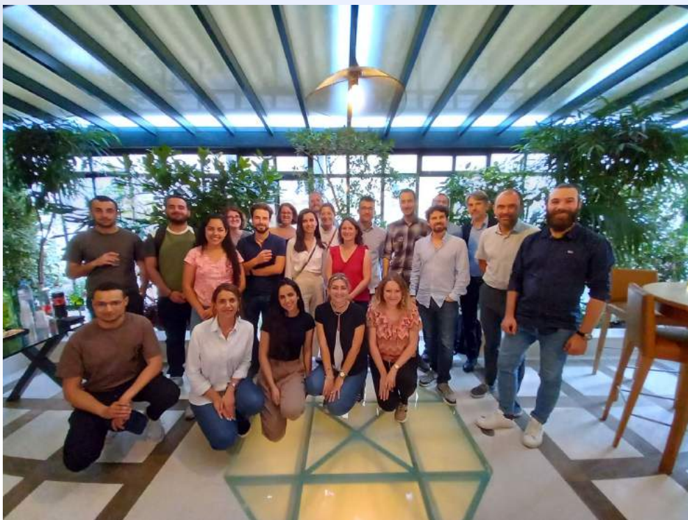
Echanges entre participants

20/06/2023 – Présentation de chantiers Hinkley Point et EDF :