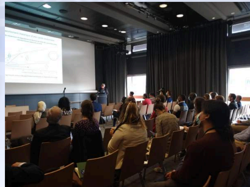
Congrès 2021 – Journée de formation