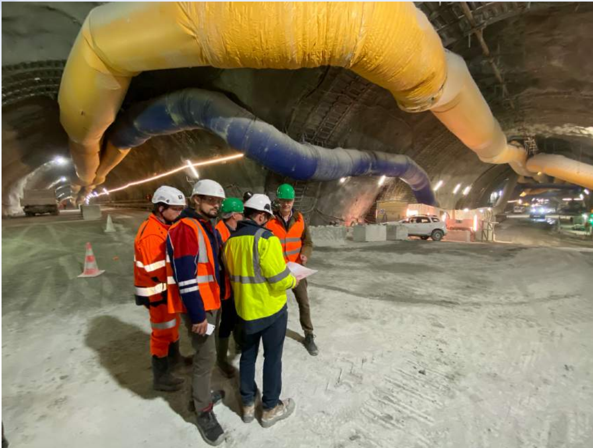
Galleries – site de sécurité de Modane

09/03/2023 – Visite des puits d'Avrieux - TELT