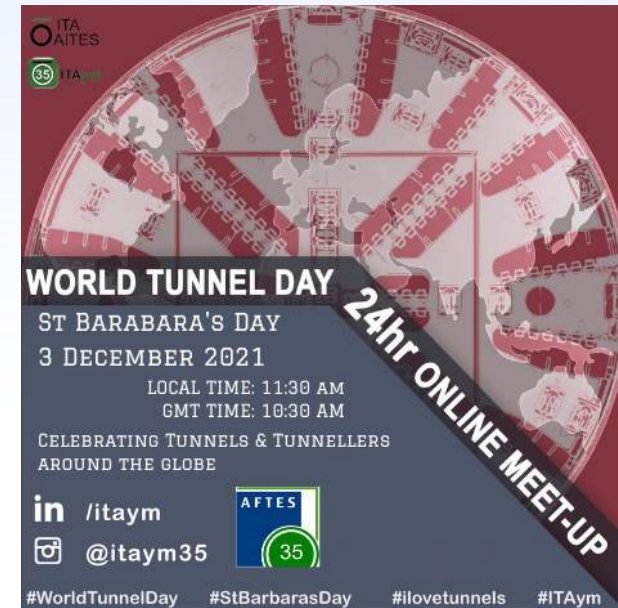
St Barbe 2021 – Marathon Zoom