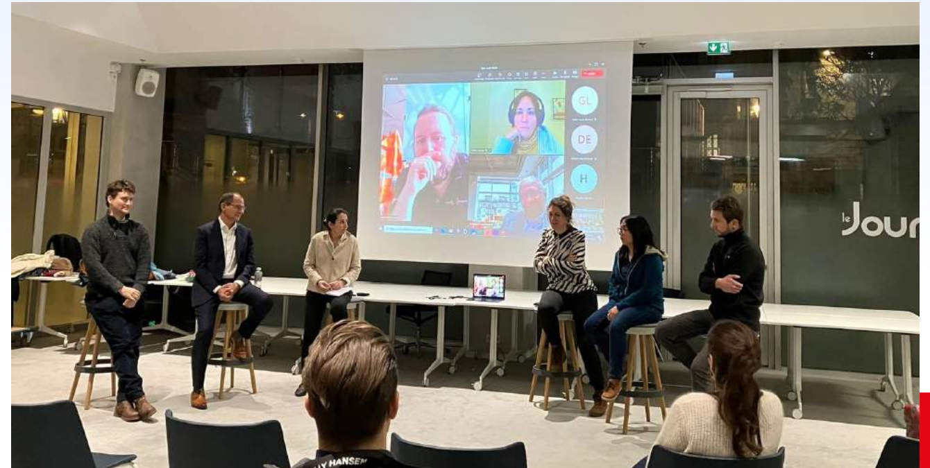
Table ronde en présentiel et en visio

& Table ronde sur la diversité sur les chantiers – avec l'association Les souterraines