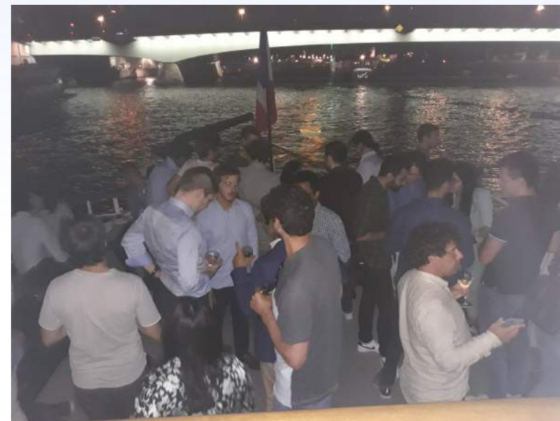
Congrès 2021 – soirée des jeunes